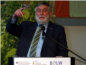
Dr. Franz Fischler