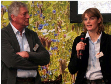
Die Preisträger des Kurgestüt Hoher Odenwald

Am Beispiel ehemaliger Preisträger wurden im Rahmen der Jubiläumsveranstaltung zukunftsweisende Konzepte des Öko-Landbaus in den Bereichen Unternehmensführung, Soziales, Naturschutz, Züchtung, Vermarktung und Tierhaltung mit z.T. ausgefallenen Aktionen präsentiert. Das Kurgestüt Hoher Odenwald aus Baden-Württemberg, welches die Auszeichnung 2007 für die gesamtbetriebliche Konzeption als Zweitplatzierter erhielt, ist die erste Stutenmilchfarm in Deutschland und produziert jährlich etwa 50.000 Liter Milch. Feinschmecker aus dem Publikum waren eingeladen, eine Kostprobe zu nehmen und den Geschmack mit Kuhmilch zu vergleichen. Nicht nur das Produkt ist ungewöhnlich, sondern mit Hofladen, Fachhandel und Internetversand auch die verschiedenen Vermarktungskanäle.