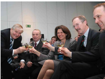
Wein des Gut Rummel wird verkostet

Das Weingut Rummel aus Baden-Württemberg erhielt 2005 den 1. Preis im Bereich Pflanzenbau und Pflanzzüchtung. Es zeichnet sich durch einen hohen Einsatz bei der Züchtung von pilzwiderstandsfähigen Weinsorten aus und leistet somit einen Beitrag für den gesamten ökologischen Weinanbau. Das Publikum konnte sich selbst von dem ausgezeichneten Geschmack des Getränkes überzeugen und bekam sogar Gelegenheit, Weinetiketten zu gestalten.